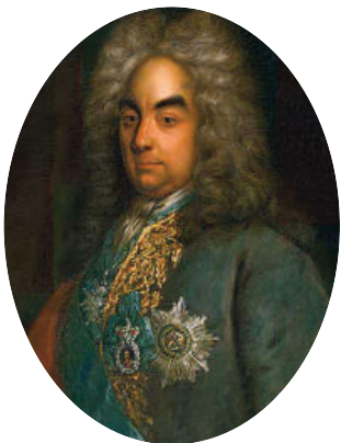
Петр Андреевич Толстой