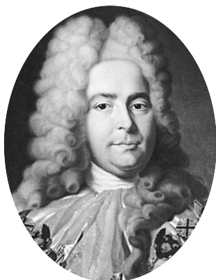
Генерал-прокурор Павел Иванович Ягужинский