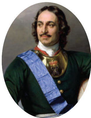
Император Петр I

Сообщениями «о похищении казны» первоначально занималась тайная канцелярия во главе с графом П.А. Толстым. И работала она на совесть. Но были и такие дворяне и чиновники, которые к проблеме мздоимства относились гораздо терпимее. По рассказам современников, однажды в Сенате Петр пригрозил издать указ, по которому всякий, кто украдет у казны сумму, на которую можно купить веревку, будет повешен. Генерал-прокурор Ягужинский на это заметил: «Неужели вы хотите остаться императором без служителей и подданных? Мы все воруют — с тем только различием, что один больше и приметнее, чем другой».